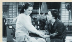
出演:原節子、笠智衆、淡島千景、佐野周二