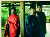
監督:滝澤洋二郎 原作:夢枕獺 出演:野村萬香 ©「陰陽師」製作委員会 東北新社 TBS 電通 内川書店 東宝