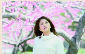
監督:瀬木直貴 出演:佐津川愛美、池内万作 © 2008 映画『春色のスープ』製作委員会

14:30- クロージング がんばれ東北!福島ロケ作品 『春色のスープ』チャリティー上映